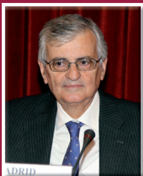
Eduardo Torres Dulce