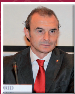
Óscar Luis Celada

premo analizó la ciencia del Derecho desde el Tribunal Supremo, un órgano que se encarga de aplicarlo en todo el territorio nacional. “Lo importante no es que estemos encargados de conocer la instrucciones de los enjuiciamientos de los aforados”, dijo, “sino también de establecer aquella doctrina que debe unificar la interpretación del Derecho”.