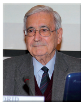
Antonio Bonet Correa

el equipo, el club... y que es mayor en deportes individuales, pues en los colectivos siempre está la opción de que el jugador pueda ser sustituido por otro, pero en los individuales la recuperación es crucial”.